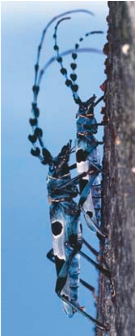
Fig. 8. Après la copulation, le mâle surveille encore sa partenaire pour éviter l'approche d'éventuels rivaux.

larves se rapprochent de la surface de l'écorce sous laquelle elles construiront, au printemps ou au début de l'été, une logette de nymphose et une galerie de sortie qu'elles bouchent à nouveau. Chez les nymphes, les longues antennes et les pattes sont déjà bien visibles (fig. 12). Les jeunes insectes émergent généralement entre juillet et début septembre avec une pointe en août, mais en juin déjà sur les pentes sud du Jura. Ils laissent sur leur substrat des trous ovales, typiques de nombreux cérambycides. La galerie de sortie est verticale. Les trous ont entre 6 et 11 mm de long et 4 à 8 mm de large; leur axe longitudinal est parallèle à celui du tronc ou de la branche (fig. 13), sauf dans le bois des racines et des excroissances où cette direction n'est pas précise. Souvent, de nombreux insectes émergent dans