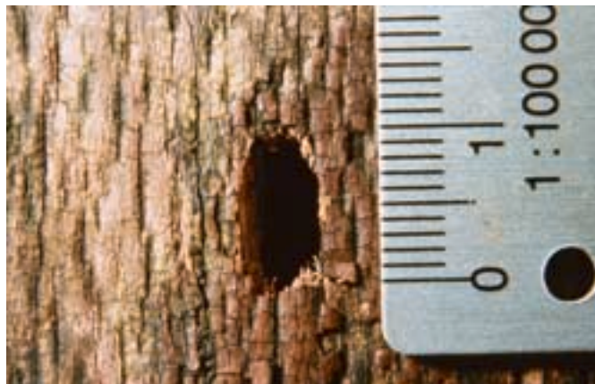
Fig. 13. Le trou de sortie mesure 10 mm de long et il évolue parallèlement aux fibres du bois.