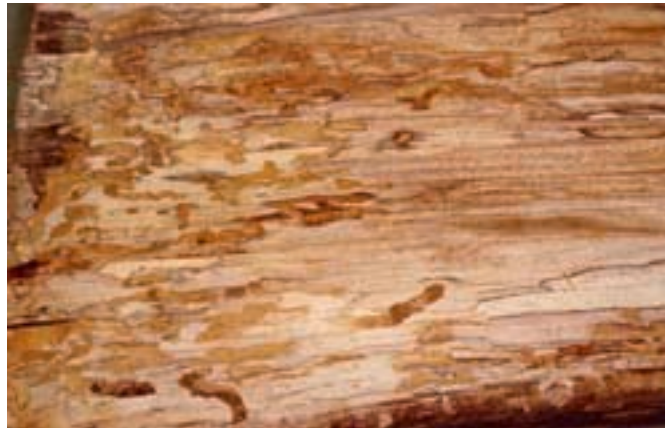
Fig. 11. Les galeries larvaires évoluent irrégulièrement dans le bois et sont remplies de sciure.

La Rosalie des Alpes est présente en Europe centrale, dans les hêtraies thermophiles de l'étage montagnard à subalpin (entre 500 et 1500 m). Ici, elle pond presque uniquement sur le hêtre ( Fagus sylvatica L.), mais des galeries larvaires ont aussi été vues dans des érables sycomores ( Acer pseudoplatanus L.). Dans les zones méditerranéennes (selon BENSE 1995), elle se développe également dans les ormes ( Ulmus ), charmes ( Carpinus ), tilleuls ( Tilia ), châtaigniers ( Castanea ), frênes ( Fraxinus ), noyers ( Juglans ), chênes ( Quercus ), saules ( Salix ), aulnes ( Alnus ), et aubépines ( Crataegus ). Elle préfère le bois pourri de hêtres malades ou morts; souches, arbres sur pied ou cassés, troncs ou branches épaisses au sol lui conviennent pour autant qu'ils soient bien ensoleillés. Le bois de hêtre récemment abattu l'attire aussi (cf. Menaces). En Suisse, la majorité des stations se situent au-dessous de 1000 m où l'in-