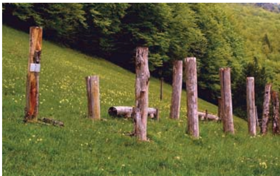
Fig. 16. Au cours d'une expérimentation, un buffet de différents troncs a été offert aux femelles de Rosalia alpina en quête de lieux de ponte.

Au cours des étés 2001 et 2002, l'Institut fédéral de recherches WSL a concocté un «buffet» à l'intention de Rosalia dans trois stations connues: le Val Verzasca, le Prättigau et le Jura. Un choix de troncs de hêtres morts de différentes qualités lui a été offert à chaque endroit (fig. 16). Ce buffet comprenait dix troncs de hêtres alignés sur deux rangs et deux troncs de frêne à chaque extrémité. Les insectes pouvaient choisir entre les sections de troncs longs (2 m) ou courts (1 m), couchés ou sur pied, gros (>25 cm) ou minces (<20 cm). Parmi les troncs gros, longs et sur pied, ils avaient aussi le choix entre des hêtres ayant grandi sur un sol acide ou calcaire.