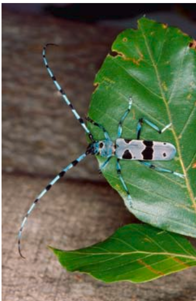
Fig. 1. Ce magnifique mâle se repose à proximité d'un stock de bois de hêtre.

La Rosalie des Alpes est l'un des coléoptères les plus beaux, les plus grands et les plus rares d'Europe. Il vit dans des hêtraies qui ne sont ni rares ni menacées en Europe centrale. Mais pour que ses larves puissent se développer, Rosalia alpina doit disposer durant plusieurs années de bois mort de hêtre exposé au soleil. Or les endroits où pousse cette essence en Suisse sont aussi habités depuis