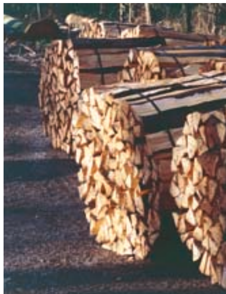
Fig. 15. Le bois de hêtre destiné au chauffage peut devenir un piège si la Rosalie des Alpes y dépose ses œufs. Dans le bois fendu, les larves ne parviennent guère à se développer, sans compter qu'elles risquent fort d'aboutir dans un fourneau.

Les conditions d'habitat nécessaires à R. alpina ont été l'objet de diverses observations et rapports, parfois contradictoires et anciens, mais il existe peu d'études scientifiques récentes à ce sujet.