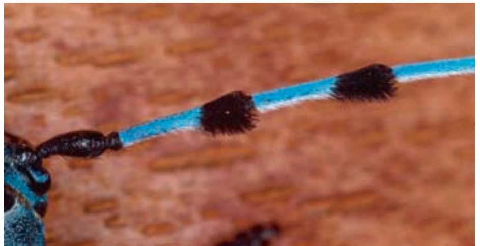
Fig. 4. Antenne portant des touffes typiques de poils noirs aux extrémités de certains articles.

Cet insecte de 14 à 38 mm ne peut être confondu avec aucun autre. Le corps et les élytres sont gris-bleu à bleu ciel. Les élytres, bordées d'un filet clair, sont tachetées de noir. La grandeur et la forme de ces taches sont variables; celles du centre sont généralement réunies en une bande transversale. La configuration des taches permet de distinguer les individus. Les longues antennes, qui portent des touffes de poils noirs entre le troisième et le sixième article, ont aussi un aspect caractéristique (fig. 4). Les sexes sont facilement re-