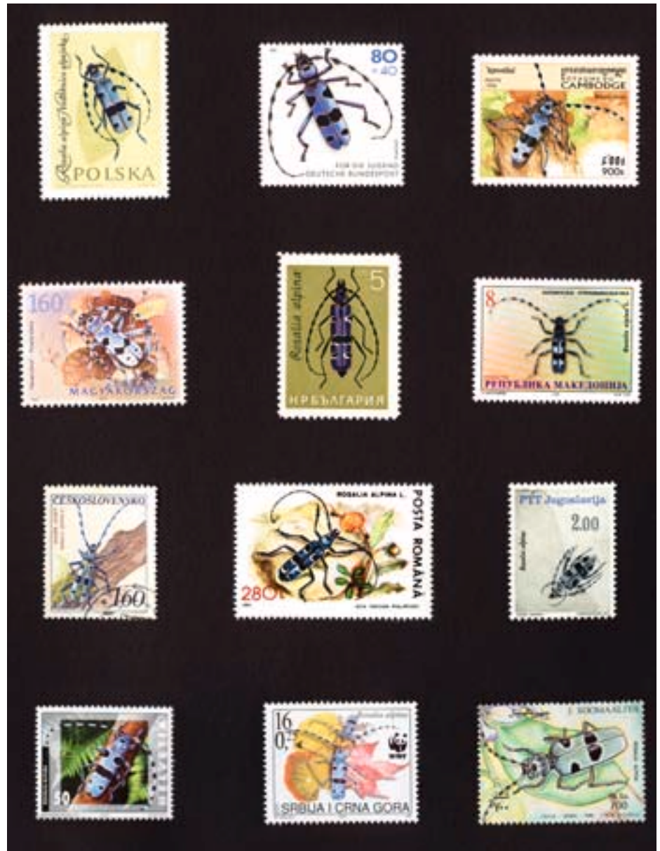
Fig. 17. Grâce à sa beauté, la Rosalie des Alpes a eu l'honneur de décorer les timbres-poste de nombreux pays (collection P. Duelli).

Les insectes, notamment les papillons diurnes comme le machaon, sont aussi représentés dans la ligue des espèces emblématiques. Aujourd'hui, la Rosalie des Alpes en fait certainement partie en Europe. Elle figure déjà sur les timbres de douze pays (fig. 17). La poste suisse lui a consacré un timbre de 50 centimes en 2002. En 2001, elle fut l'insecte de l'année en Autriche. Elle est aussi l'une des 149 espèces du «Réseau Émeraude» du WWF Suisse ( www.wwf.ch/emeraude ).