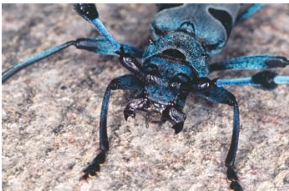
Fig. 7. La Rosalie des Alpes possède de solides mandibules. Celles du mâle se caractérisent par une épine latérale de chaque côté.