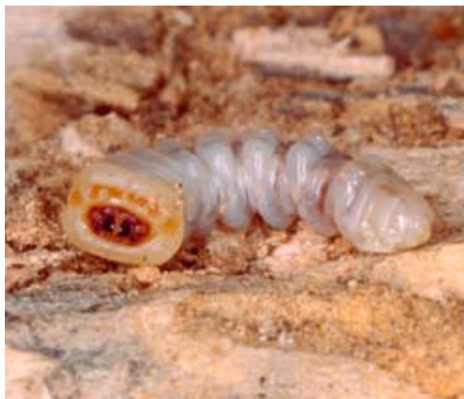
Fig. 10. Larve constituée de gros bourrelets alternants.