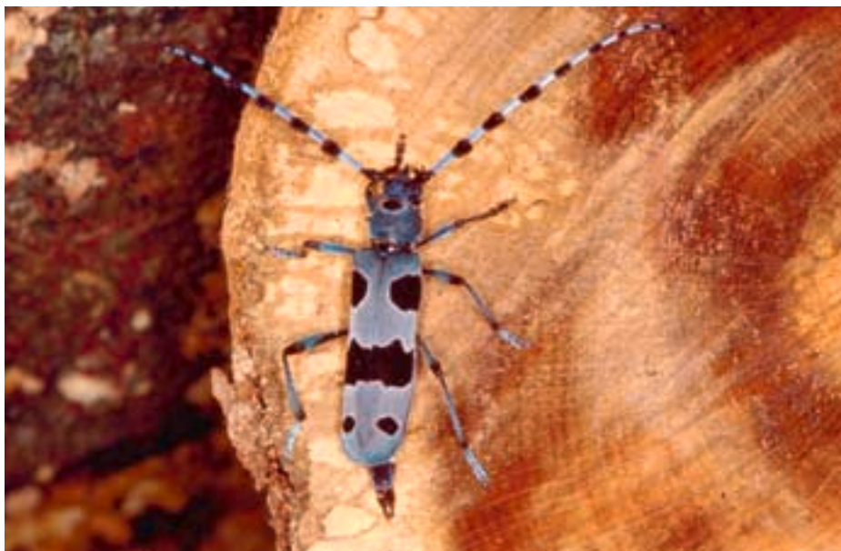
Fig. 5. A l'aide de son ovipositeur, cette femelle tâtonne un tronc de hêtre afin de vérifier si l'endroit est approprié à la ponte.

connaissables aux antennes et aux mandibules: les antennes des femelles (fig. 5) sont à peine plus longues que le corps tandis que celles des mâles (fig. 1, 6) sont presque deux fois plus grandes. En outre, leurs mandibules sont plus larges et présentent une épine sur la partie extérieure (fig. 7). Malgré ses couleurs assez remarquables, la Rosalie des Alpes se dissimule facilement sur l'écorce gris clair des hêtres.