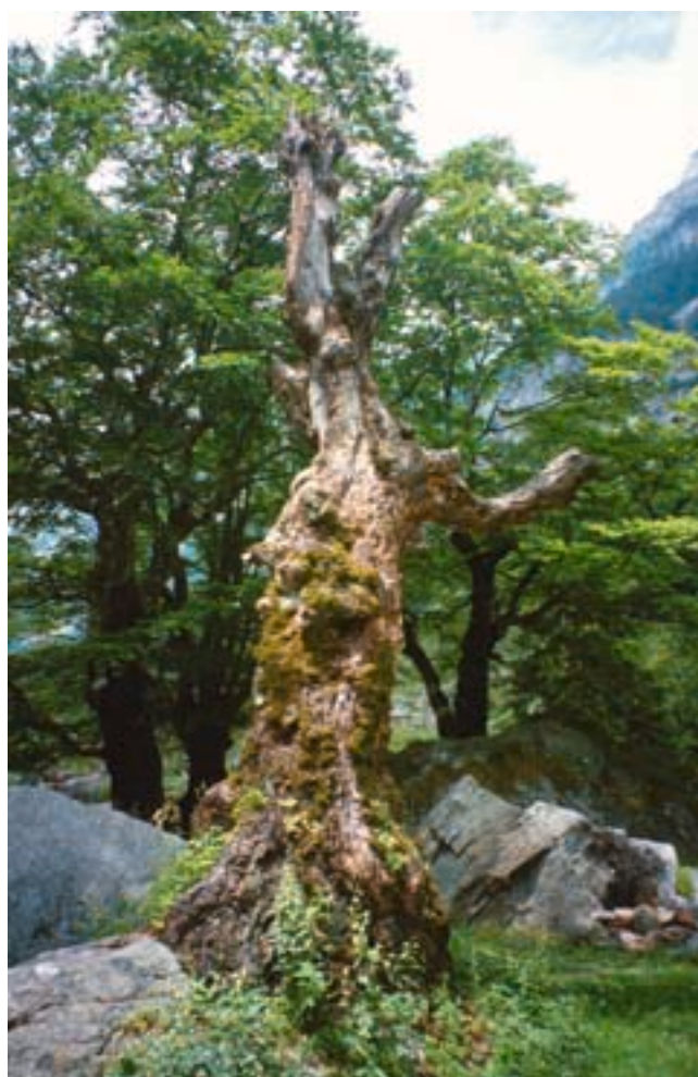
Fig. 2. Ce très vieux hêtre, dans le Val Verzasca, a vu naître de nombreuses Rosalies des Alpes.