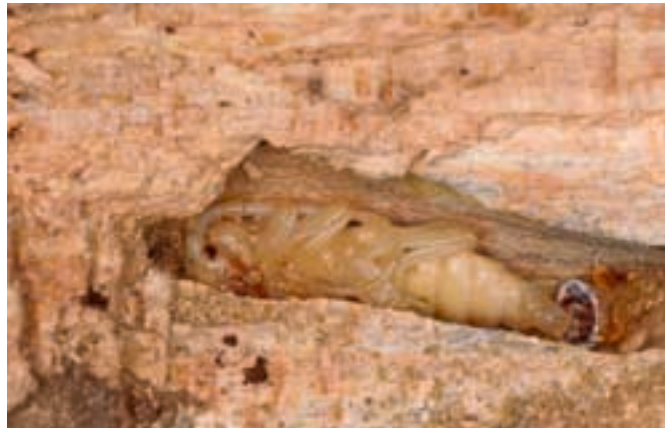
Fig. 12. Nymph de Rosalia . Les pattes et les antennes sont déjà bien visibles, tout comme l'ébauche des ailes.