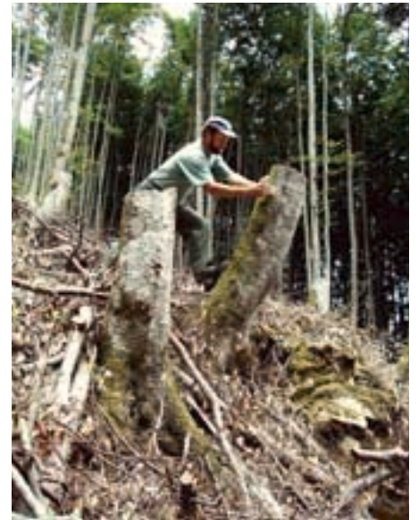
Fig. 18. Les souches hautes laissées dans le peuplement après une coupe favorisent l'insecte et protègent contre les chutes de pierres. Ici, une Rosalia trouvée à proximité de bois de chauffage est remise en liberté.

En général, il est recommandé de laisser sur place les vieux hêtres endommagés ou morts dans les endroits ensoleillés (cp. fig. 2). Les troncs de hêtre et le bois de chauffage destinés à la vente devraient être évacués ou entreposés à l'ombre avant l'été, période d'essaimage de l'insecte. Il est opportun de laisser quelques souches ou troncs de hêtre de moindre qualité sur les aires de chablis. Au moment des coupes, il serait utile de laisser sur pied quelques vieux hêtres et hautes souches (fig. 18). En outre, des troncs peuvent être appuyés et fixés contre les arbres sur pied exposés au soleil. Le bois au sol et les petites souches ne sont pas appropriés au développement de la Rosalie des Alpes.