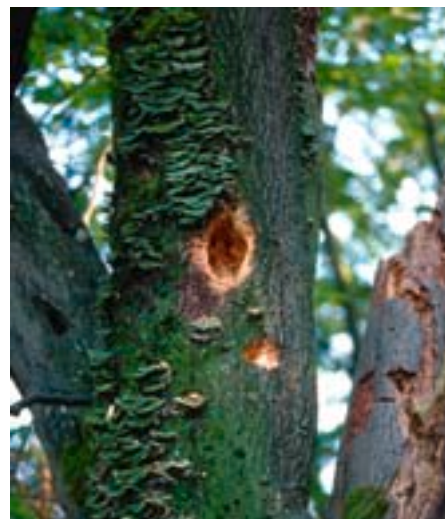
Fig. 14. Tout comme de nombreux autres cérambycides, la Rosalie figure au menu des pics.