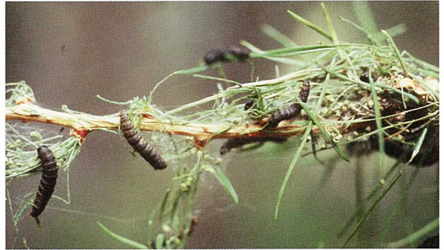
Lärchenzweig mit Raupen und Gespinst.

Im Spätsommer legen die Schmetterlingsweibchen in Rindenritzen und unter Flechten je rund 150 Eier ab. Im folgenden Frühling schlüpfen daraus kleine, hellgelbe Raupen. Sie ernähren sich von Lärchennadeln und häuten sich innert 6 bis 8 Wochen viermal. Die ausgewachsenen Raupen sind tiefschwarz und 10 bis 15 mm lang. Auf der Suche nach neuer Nahrung kriechen die Raupen auf den Zweigen umher und scheiden dabei ein weissliches Gespinst aus. Ab Juli seilen sich die Raupen an selbstgesponnenen Fäden von den Bäumen ab. Anschliessend verpuppen sie sich in der Bodenstreu. Nach ungefähr einem Monat schlüpfen die Falter, welche dämmerungs- und nachtaktiv bis Oktober leben können.