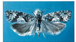
Lärchenwickler ( Zeiraphera diniana ).