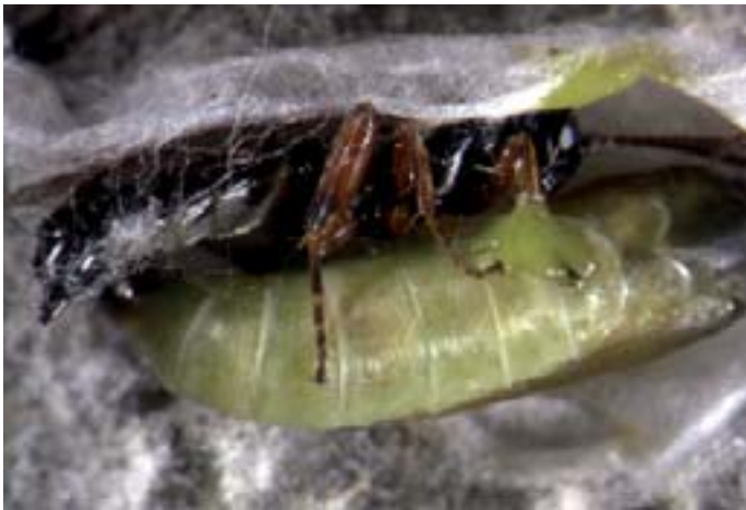
Fig. 13. Herpestomus brunnicornis è un controparassita icneumonide altamente specializzato che colpisce sia le larve che le crisalidi. Il suo ovodepositore è infatti molto corto; per deporre le uova nel corpo della larva questa vespa deve penetrare all'interno del bozzolo.