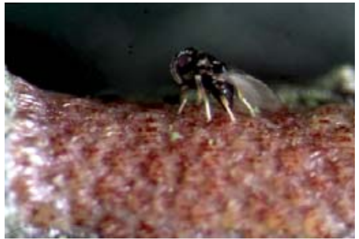
Fig. 16. Una vespa di Ageniaspis fuscicollis mentre depone le sue uova in una ovoplacca di Yponomeuta .