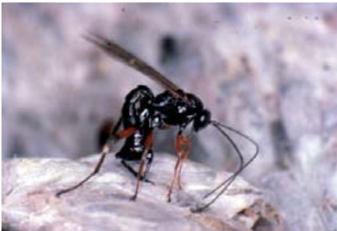
Fig. 15. Il controparassita icneumonide Itopectis maculator depone le sue uova all'interno delle crisalidi grazie ad un lungo ovodepositore in grado di penetrare nei bozzoli.