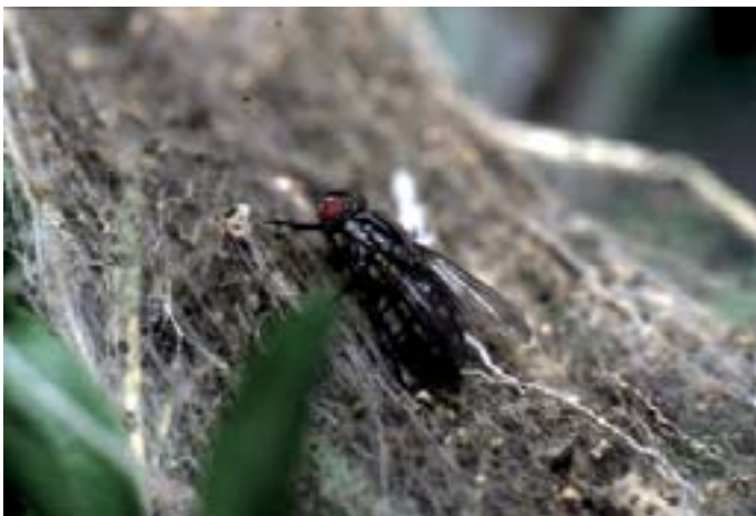
Fig. 17. Una larva della mosca predatrice Agria mamillata divora da 5 a 8 crisalidi di tignola nell'arco del suo sviluppo.