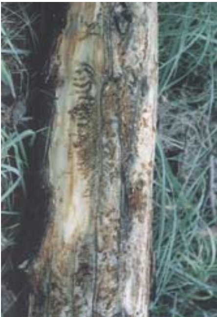
Abb. 11. Ips sexdentatus : Brutbild im Bast. Grosse, schüsselförmige Puppenwiegen im Splint, häufig von einem auffallenden Randwulst aus braunem Bohrmehl umgeben.

renstammensekten auch dichte Bestände. Neben dem Blauen Föhrenprachtkäfer wird in der Schweiz gelegentlich auch der Vierpunkt-Föhrenprachtkäfer ( Anthaxia quadripunctata ) beobachtet.