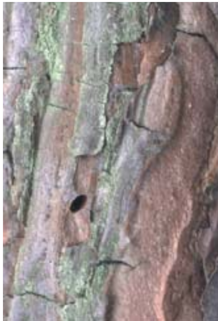
Abb. 14. Melanophila cyanea : Typisches ovales Ausflugloch (etwa 3–4 mm lang und 1 mm breit), entsprechend dem Körperquerschnitt der Käfer.