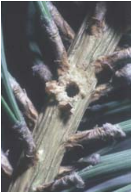
Abb. 6. Waldgärtner: Frass (v.a. Reifungsfrass) an gesunden Kronentrieben. Das Einbohrloch ist deutlich mit einem Harztrichter markiert.

sunden Trieben der Baumkrone, allerdings vorzugsweise an diesjährigen Trieben (Maitrieben), wo sie bis 15 cm lange Gänge minieren. Der Reifungsfrass dauert wesentlich länger als der Regenerationsfrass und kann sich bis weit in den Herbst hinziehen. Jeder Jungkäfer höhlt im Mittel 2 Triebe aus, deren Gänge stets bohrmehlfrei sind (Tab. 3).