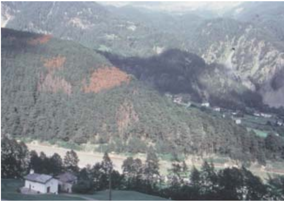
Abb. 9. Ips acuminatus : Alte und neuere Befallsherde.