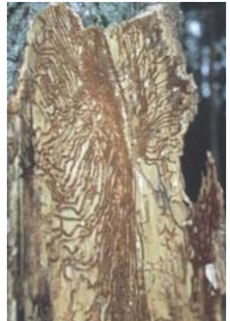
Abb. 4. Tomicus piniperda : Brutbild in der Rinde.