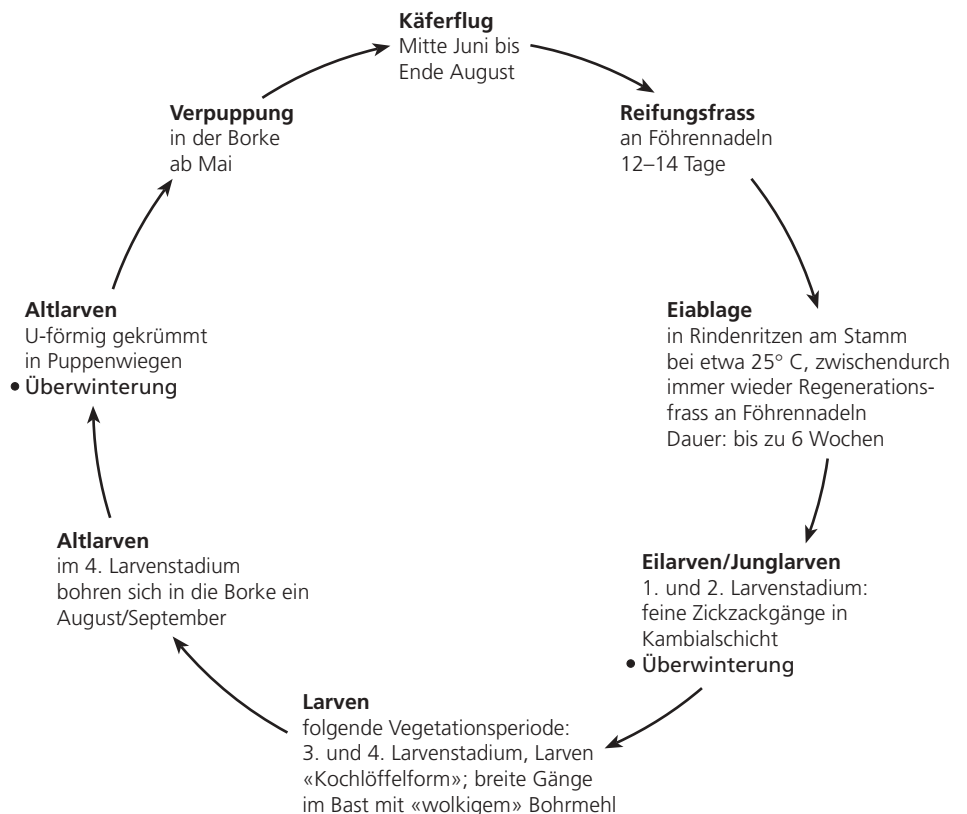
Abb. 12. Entwicklungszyklus des Blauen Föhrenprachtkäfers Melanophila (Phaenops) cyanea (zweijährige Generation an stehenden, nur schwach geschädigten Föhren während der Latenzzeit).

Trockenstress der Föhren, der die Bast- und Splintfeuchte, das Harzungsvermögen und den Radialzuwachs (Überwallungsvermögen) und damit das aktive Abwehrvermögen des Wirtsbaumes verringert, begünstigt den Prachtkäferbefall und die Entwicklung dessen Larven, so dass es zu Massenvermehrungen kommen kann, häufig verbunden mit einem