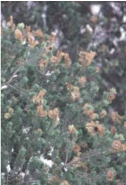
Abb. 8. Waldgärtner: Absterbende Triebenden nach Reifungsfrass.

Zähne, von denen der unterste beim Männchen zweispitzig ist. Beim etwas grösseren Weibchen sind alle Zähne einfach (Abb. 2c), der oberste fehlt gelegentlich. Der wärmeliebende Käfer schwärmt gewöhnlich erst im Mai (Tab. 1). Im Unterschied zu den Tomicus -Arten besetzt bei den Ips -Arten zuerst das Männchen den