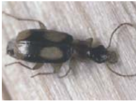
Abb. 19. Laufkäfer der Gattung Dromius (hier Dromius quadrimaculatus , 5–6 mm lang) sind bedeutende Borkenkäferläufer.