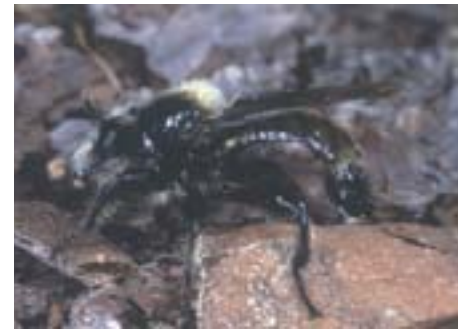
Abb. 20. Larven und erwachsene Tiere der Raubfliege Laphria flava (16–25 mm lang) jagen bevorzugt Prachtkäfer, aber auch Borkenkäfer.