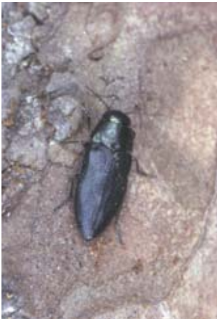
Abb. 13. Melanophila cyanea : Erwachsener Käfer, 7–12 mm lang.