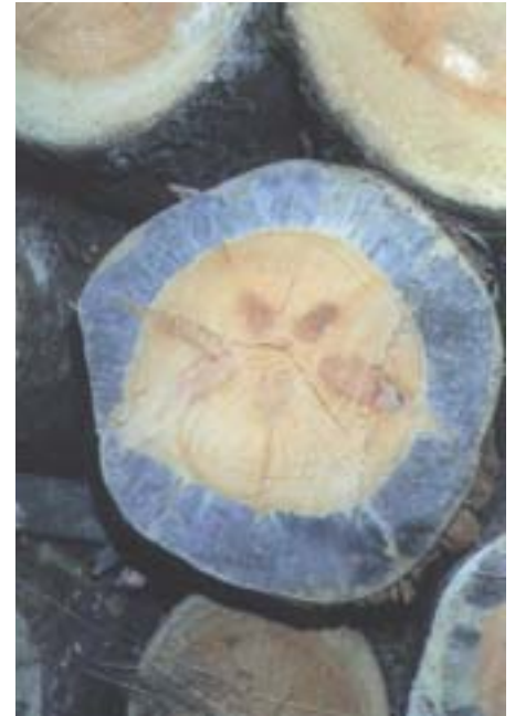
Abb. 17. Verbläuung von Föhrenholz durch Bläuepilze.

Unbefallene Äste können bei einer Nutzung im Spätsommer liegengelassen werden. Auf sonnigen Standorten trocknen sie rasch aus und sind im folgenden Frühling oft nicht mehr attraktiv.