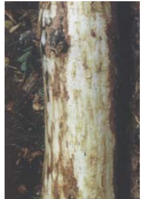
Abb. 15. Melanophila cyanea : Feine zickzack-förmige Larvengänge des 1. und 2. Larvenstadiums.

Wechsel von zwei- zu einjähriger Generationsfolge.