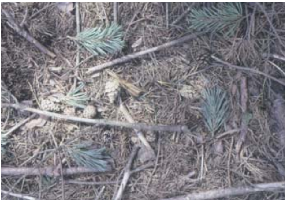
Abb. 7. Waldgärtner: Triebabbrüche am Boden.

Auch jüngere Bäume können zur Überwinterung angegangen werden. Die Käfer benutzen mehrere Jahre hintereinander die gleichen Winterquartiere. Der Kleine Waldgärtner überwintert häufig in der Bodenstreu, zum Teil aber auch in den Trieben (Tab. 1).