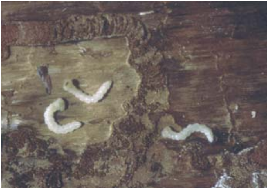
Abb. 16. Melanophila cyanea : Ausgewachsene Larven («Kochlöffelform») neben ihren Frassgängen mit der typischen lagenweisen Schichtung des Bohrmehls.