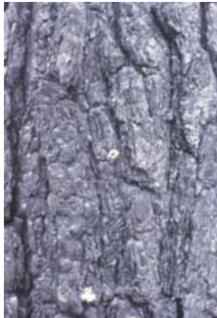
Abb. 3. Waldgärtner: Sekundärer Befall nach Waldbrand. Am Föhrenstamm Einbohrlöcher mit Harztrichter. Den Ausbohrlöchern fehlen die Harztrichter.

Bei hoher Populationsdichte und geringem Brutraumangebot bleiben die Muttergänge kurz mit entsprechend reduzierter Eizahl. Die dichtgedrängten, ebenfalls im Bast liegenden, bis 10 cm langen Larvengänge verlaufen rechts und links des Mutterganges waagrecht, bei starkem Befall unregelmässig, sich oft durchkreuzend (Abb. 4).