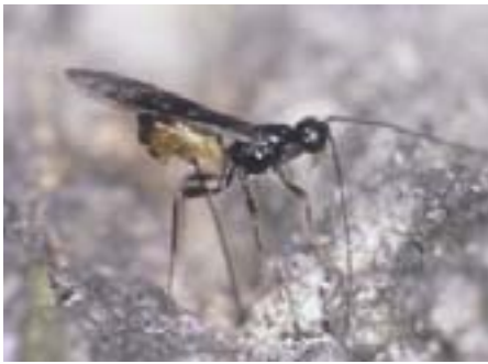
Abb. 18. Brackwespe der Gattung Coeloides (2,5–4 mm lang) bei der Eiablage. Ihre Larven schwarzen an Borkenkäferlarven, seltener an Prachtkäferlarven.