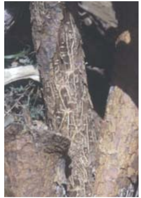
Abb. 10. Ips acuminatus : In den Splint eingeschnittenes Brutbild.

Ausgehend von stark besiedelten Poltern, Windwürfen oder brandgeschädigten Föhren kann ein Befall auch auf vital stehende Altföhren oder auf jüngere Bäume übergreifen. Ips sexdentatus tritt besonders an Südrändern eines Waldes, in Bestandeslücken und in aufgelichteten Beständen auf.