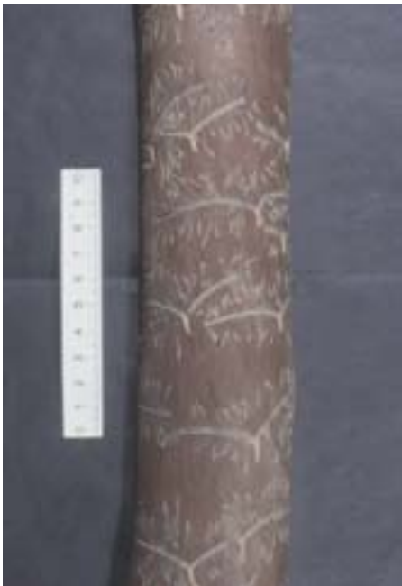
Abb. 5. Tomicus minor am stehenden Stamm: Brutbild mehrheitlich im Splint; Puppenwiegen radial im Splint, als kreisrunde Eingangslöcher auf der Splintoberfläche sichtbar.