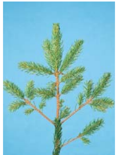
Abb. 3 Chrysomyxa rhododendri : Befall im letzten Jahr. Mit Ausnahme einzelner, schwach erkrankter Nadeln sind die meisten im vorjährigen Herbst abgefallen, der jüngste diesjährige Nadeljahrgang ist bereits wieder infiziert.

Fichtenrostpilze gehören zur Familie der Melampsoraceae (Unterfamilie Chrysomyxaceae). Chrysomyxa rhododendri , der bereits 1879 von dem Biologen Anton de Bary untersucht und beschrieben wurde, wechselt zwischen den Wirtspflanzen Alpenrose und Fichte. Auf den beiden Alpenrosenarten Rhododendron ferrugineum und Rhododendron hirsutum (Tab. 1) vermag der Pilz zu überdauern und sich zu vermehren, gleichzeitig sind Alpenrosen Überwinterungsorte für sie. Der zweite Wirt ist die Fichte, vor allem Picea abies , aber auch andere nichtheimische Fichtenarten (Tab. 1). Bevorzugt werden junge Fichten infiziert, aber auch ältere Bäume können betroffen sein. Dieser Rostpilz ist in seiner Lebensweise nicht unbedingt auf die Fichte angewiesen und kommt deshalb auch ausserhalb von Fichtenverbreitungsgebieten vor. Chrysomyxa rhododendri ist sehr häufig in den Alpen und in anderen europäischen Gebirgen sowie in Nordamerika und Ostasien. In der Schweiz kommt die Fichte etwa in Höhenlagen zwischen 1000 und 2000 m ü. M.