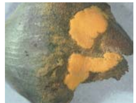
Abb. 8 Chrysomyxa pyrolata : grosse Sporenlager (Aecidien) an der Aussenseite der infizierten Fichtenzapfenschuppe.

Chrysomyxa rhododendri , die auffälligste und häufigste Rostpilzart an Fichtennadeln, ist seit mehr als 100 Jahren im Alpenraum bekannt. Dennoch wurde bisher nie ein massenhaftes Absterben befallener Bäume dokumentiert. Auch die Alpenrosen werden durch den