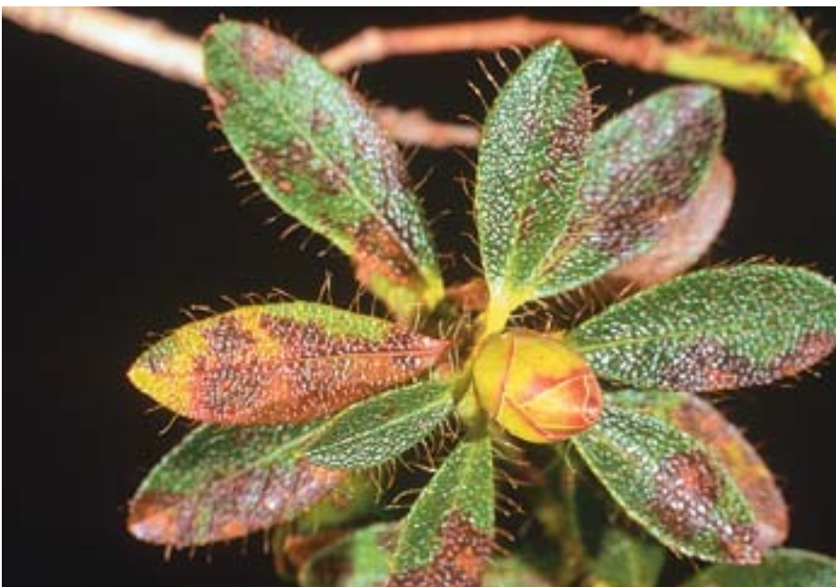
Abb. 4 Chrysomyxa rhododendri : nach Freilassen der Basidiosporen fallen die Teleutolager auf den Alpenrosenblättern zusammen und sterben ab. Auf der Blattunter- und -oberseite bleiben als Zeichen ehemaliger Pilzinfektionen braune Flecken zurück.

renwolken eingehüllt werden. Nach der Sporenfreisetzung bleiben die leeren Aecidien als auffallend weisse, unregelmässig aufgerissene Häutchen auf den diesjährigen Nadeln zurück (Abb. 1.3a). Infizierte Nadeln der Triebenden sind auffallend leuchtend gelb verfärbt (Abb. 2) und fallen im Herbst, gelegentlich auch erst im Winter ab (Tab. 2). An stark befallenen Bäumen kann so ein ganzer Nadeljahrgang ausfallen, zurück bleiben kahle Triebe. Die Knospen werden