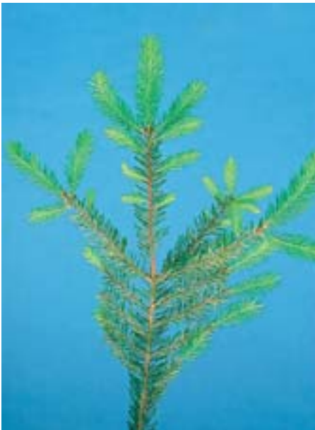
Abb. 7 Chrysomyxa abietis : erkrankte, verfärbte Nadeln, die am Baum überwinterten, werden im folgenden Sommer abgeworfen; der Nadelneuaustrieb ist bereits wieder infiziert (Querbänderbildung).

bare Anzeichen einer «Erkrankung» sind wie bei Chrysomyxa rhododendri gelb-grüne, später orange-gelbe Querstreifen auf den Nadeln. Der Pilz durchwächst das Nadelgewebe und bildet gegen den Herbst Sporenlager (Teleutolager), in denen Teleutosporen angelegt werden. In diesem Stadium überwintert der Pilz in den lebenden Nadeln. Im folgenden Frühjahr entwickeln sich die Lager allmählich zu auffällig dunkel orangerot gefärbten, samtartigen, bis zu 10 mm langen Polstern weiter (Abb. 5 und 6). Die Teleutosporen reifen im Mai/Juni und produzieren bei ihrer Keimung Basidiosporen, die durch den Wind verbreitet werden und wiederum austreibende Fichtennadeln infizieren. Aecidio- bzw. Uredolager werden bei Chrysomyxa abietis nicht gebildet. Die erkrankten Nadeln überwintern am Baum (Abb. 7) und fallen im darauffolgenden Sommer ab (Tab. 2).