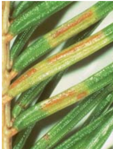
Abb. 5 Chrysomyxa abietis : nach der Schneeschmelze werden die bräunlichen Sporenlager (Teleutolager) allmählich auf den Querbändern von Fichtennadeln sichtbar.

renwolken eingehüllt werden. Nach der Sporenfreisetzung bleiben die leeren Aecidien als auffallend weisse, unregelmässig aufgerissene Häutchen auf den diesjährigen Nadeln zurück (Abb. 1.3a). Infizierte Nadeln der Triebenden sind auffallend leuchtend gelb verfärbt (Abb. 2) und fallen im Herbst, gelegentlich auch erst im Winter ab (Tab. 2). An stark befallenen Bäumen kann so ein ganzer Nadeljahrgang ausfallen, zurück bleiben kahle Triebe. Die Knospen werden