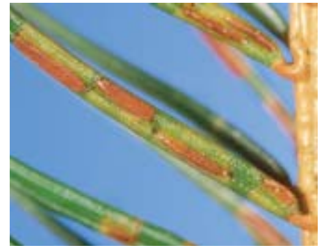
Abb. 6 Chrysomyxa abietis : reife, bis zu 10 mm lange rostbraune Teleutolager.

vom Pilz nicht befallen und können im kommenden Frühjahr wieder austreiben (Abb. 3).