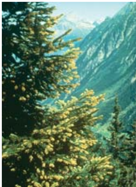
Abb. 2 Chrysomyxa rhododendri , ein typischer Rostpilz des subalpinen Alpenraumes: starke Infektion des jüngsten Fichtennadeljahrgangs.