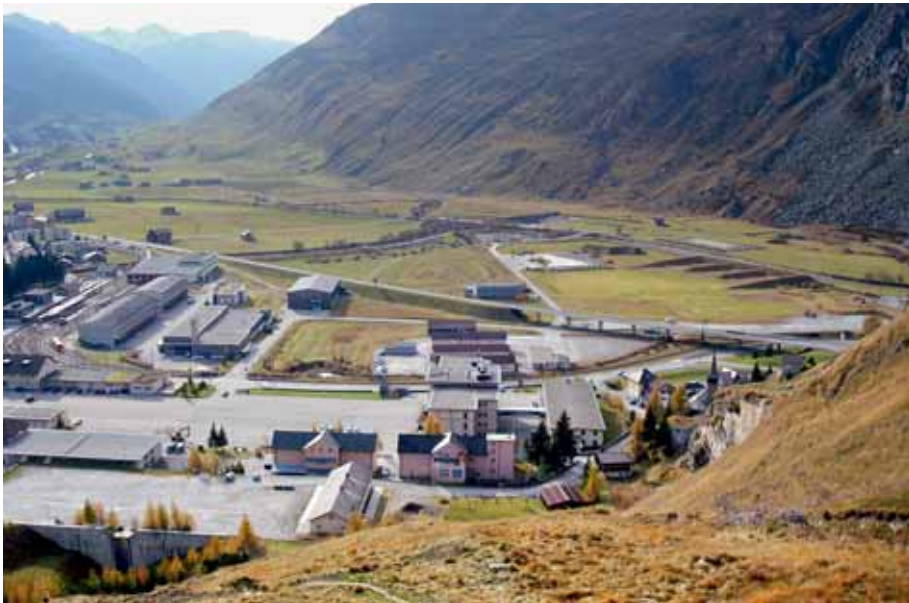
Abb. 2: Von der Gebirgskampfschule zum Tourismusressort: Andermatt als Ausnahmefall

fehlender planungsrechtlicher Grundlagen – als sehr hoch eingeschätzt.