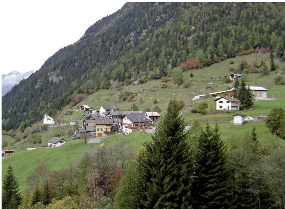
Abb. 1: Altanca, Valle Leventina (TI).

lungssystems wahrscheinlich, womit die Zielformulierung für die dezentrale Besiedlung und deren Umsetzung weitestgehend den Kantonen überlassen würde.