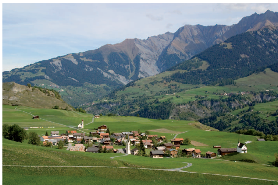
Abb. 2: Degen im Tal Lumnezia (GR).

Vor diesem Hintergrund liegt es an den betroffenen Kantonen sich zu überlegen, welche dezentralen Siedlungs- und Wirtschaftsstrukturen langfristig erstrebenswert sind. Unter dem Stichwort «Poten-