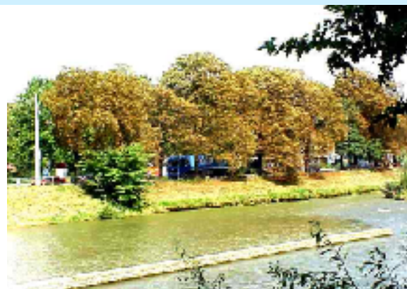
Befall durch die Rosskastanien-Miniermotte im Spätsommer

Verfärbt sich das Blattwerk der Rosskastanie ( Aesculus hippocastanum ) bereits im Sommer braun, so können verschiedene Einflüsse dafür verantwortlich sein. Streusalzschäden sowie Trockenheit, aber auch der Blattbräune-Pilz Guignardia aesculi erzeugen aus der Ferne betrachtet ein nahezu identisches Krankheitsbild wie ein Befall durch die Rosskastanien-Miniermotte Cameraria ohridella . Dieser Kleinschmetterling ist erst kürzlich aus dem Osten zugewandert und breitet sich zur Zeit in Mitteleuropa aus. Am gleichen Baum können gleichzeitig die Miniermotte, der Blattbräune-Pilz und Salzschadenssymptome vorhanden und in unterschiedlichem Ausmass für die Blattverfärbungen verantwortlich sein.