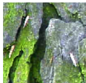
Papillon sur l'écorce d'un tronc