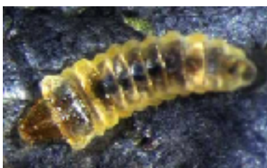
Chenille de la teigne