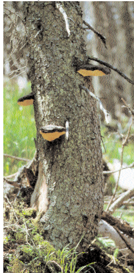
Bild 5: Der Rotrandige Baumschwamm (Fomitopsis pinicola) baut vor allem Zellulose ab. Er verursacht eine Braunfäule und bevorzugt eher feuchtere und kühlere Bedingungen.