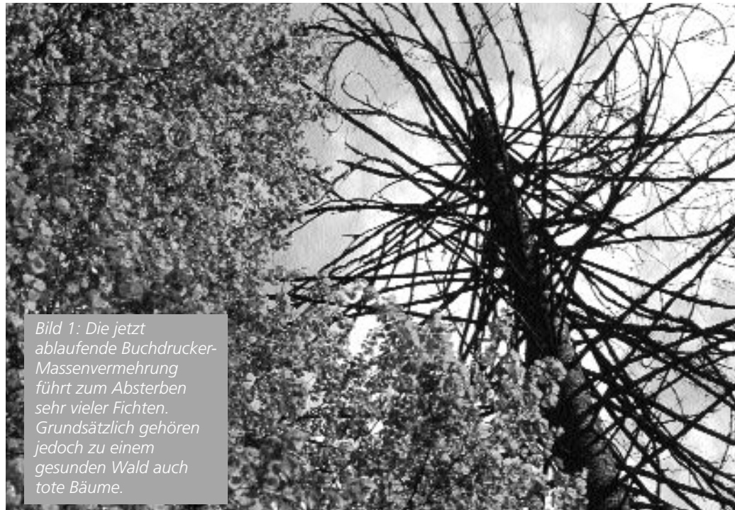
Bild 1: Die jetzt ablaufende Buchdrucker-Massenvermehrung führt zum Absterben sehr vieler Fichten. Grundsätzlich gehören jedoch zu einem gesunden Wald auch tote Bäume.

Da eine Zwangsnutzung von toten, aber noch von Borkenkäfern besiedelten Bäumen als Bekämpfung wirkungsvoll sein kann, drängen sich gerade vor dem Hintergrund der laufenden Massenver-