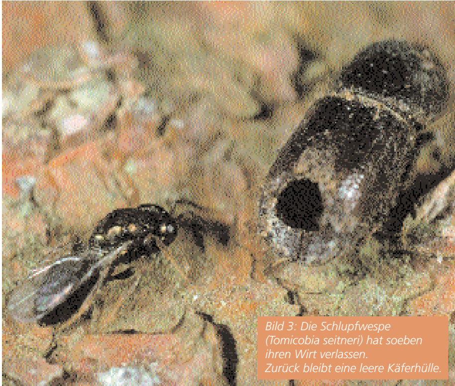
Bild 3: Die Schlupfwespe (Tomicobia seitneri) hat soeben ihren Wirt verlassen. Zurück bleibt eine leere Käferhülle.