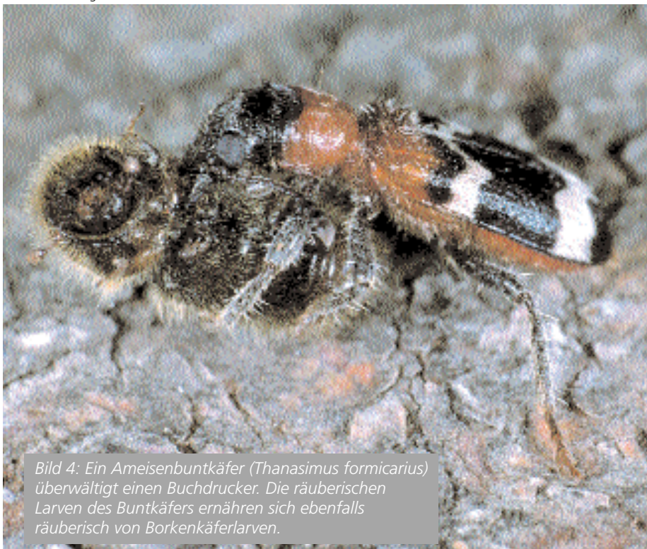
Bild 4: Ein Ameisenbuntkäfer (Thanasimus formicarius) überwältigt einen Buchdrucker. Die räuberischen Larven des Buntkäfers ernähren sich ebenfalls räuberisch von Borkenkäferlarven.