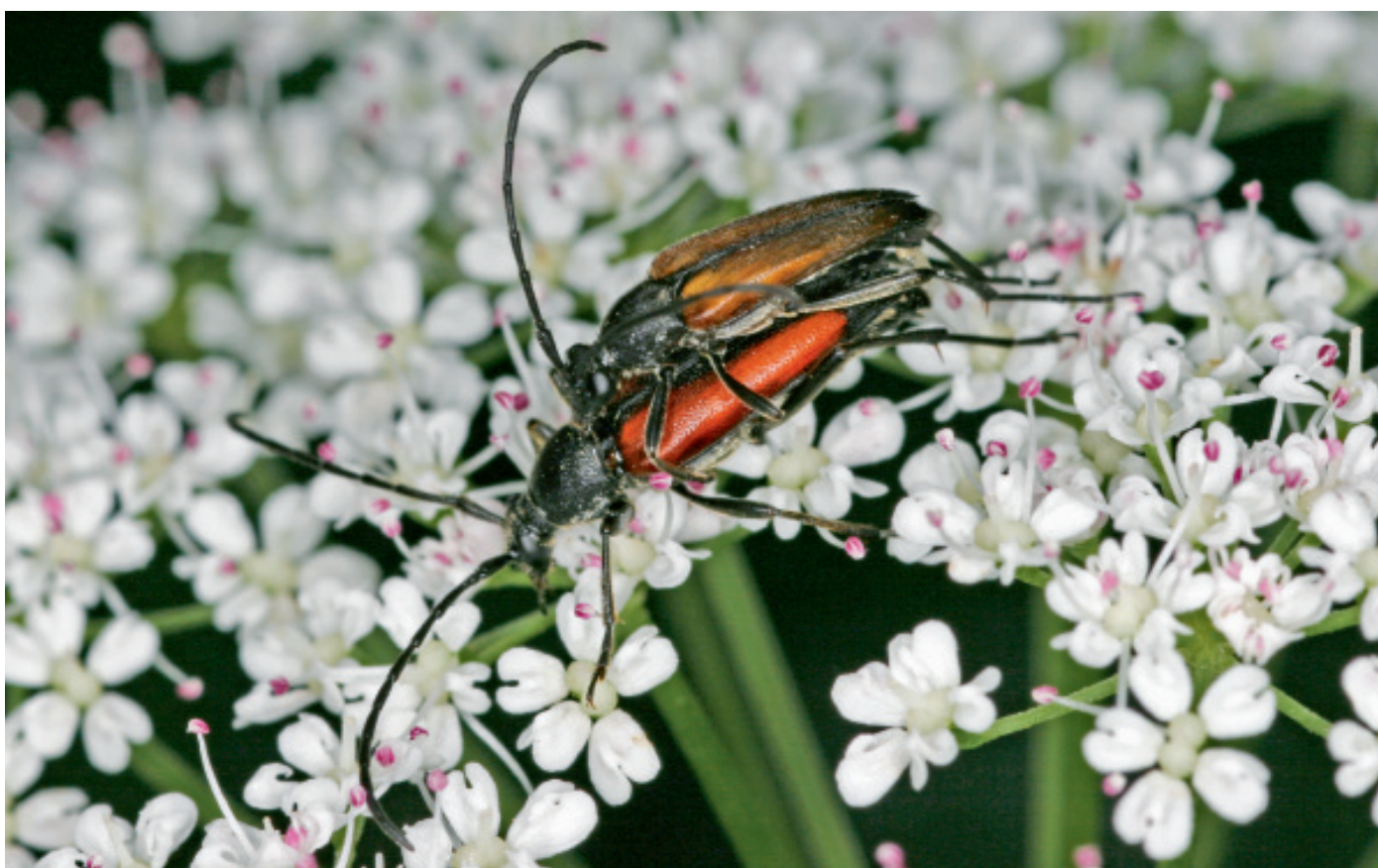
Illustration 1: le lepture à suture noire en phase d'accouplement. Après la ponte, ses larves se développent dans le bois mort alors que les adultes se nourrissent de pollen de fleurs.

Par Martina Caminada, Thibault Lachat, Beat Wermelinger et Andreas Rigling*