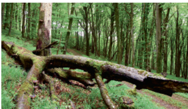
Illustration 4: bois mort à terre dans une hêtraie.