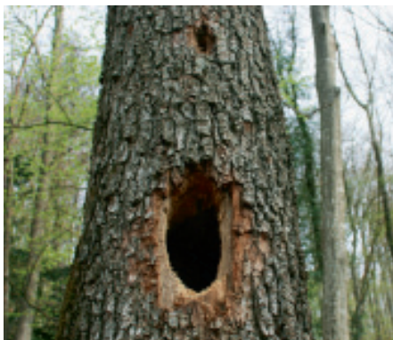
Illustration 2: trous de pics dans le tronc d'un arbre.

des forêts naguère exploitées de façon extensive. Ce qui limiterait fortement les habitats des espèces saproxyliques menacées.