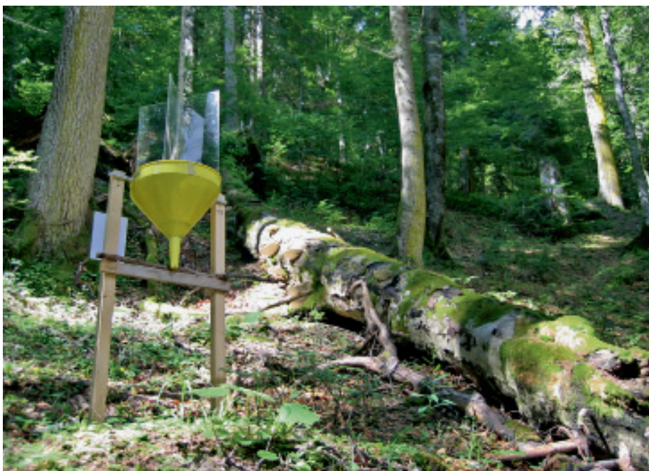
Illustration 3: piège combiné dans une hêtraie à sapins.

Sur les dix surfaces étudiées, deux se sont démarquées nettement en termes de coléoptères: la forêt de production située près d'Othmarsingen, riche en espèces mais pauvre en bois mort, et la réserve forestière naturelle proche de Saint-Ursanne, riche en bois mort mais extrêmement pauvre en espèces. La quantité de bois mort n'a donc pas suffi à déterminer à elle seule la diversité des espèces. Au contraire, la luminosité sur les sites équipés de pièges et les structures d'habitats déjà décrites ont aussi permis au peuplement plus pauvre en bois mort de présenter de précieux habitats pour les espèces saproxyliques. Alors que la réserve forestière naturelle du Jura, constituée en grande partie d'une densité élevée d'arbres à diamètre relativement faible, ne bénéficiait que très peu de lumière, la forêt de production argovienne comportait quelques vieux arbres sur pied de très large diamètre et de très nombreuses clairières. De ce fait, une strate herbacée abondante aux multiples plantes à fleurs avait recouvert le sol. Il importe toutefois de noter que cette étude s'est essentiellement concentrée sur les groupes de coléoptères nectarivores et que, parmi ces derniers, aucune espèce rare n'a été identifiée. Pour des espèces d'insectes qui ne butinent pas les fleurs et qui sont plus rares (celles qui colonisent par exemple les champignons), la comparaison entre la forêt de production et la réserve forestière pourrait se révéler tout autre.