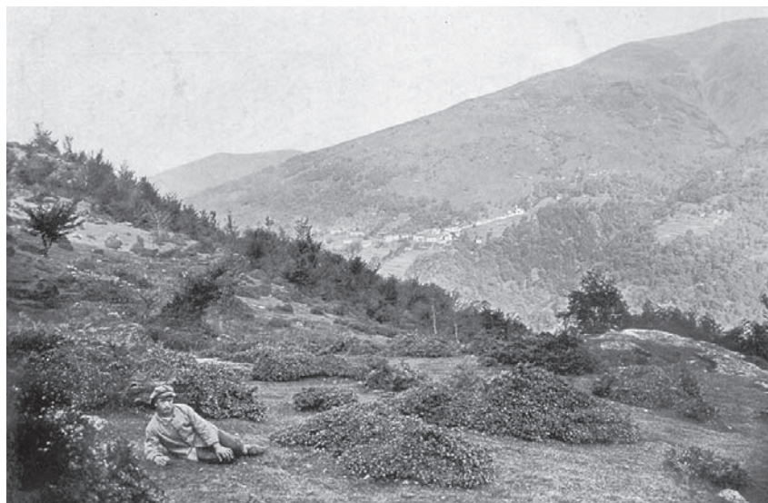
«Geissen- oder Weidbuchli»: von Ziegen und Grossvieh jahrelang abgefressene Buchen 1914 bei Sonvico, Kt. Tessin.