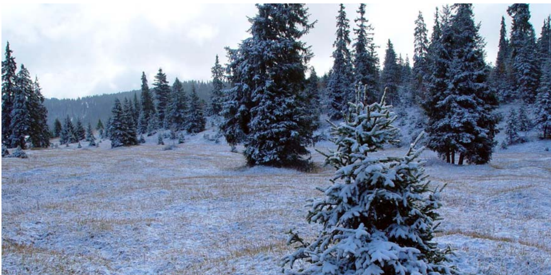
Wytweide im Waadtländer Jura. Schreibkarte Walddynamik 2003

Wiederum rechtzeitig zum Jahresende erschien die dritte Schreibkarte des Forschungsprogramms Walddynamik. Sie ist dem Kernthema «Wytweiden im Jura» gewidmet und zeigt ein Wytweide im Waadtländer Jura. Derzeit steht die Entscheidung an, ob und wie die Landwirtschaftspolitik die Erhaltung dieser artenreichen Ökosysteme und beliebten Erholungsgebiete fördern wird. Denn: Wird die Weidewirtschaft künftig noch stärker reduziert, verwalten diese traditionellen Landschaften. Die Experimente im Programm Walddynamik sollen zeigen, wie sich die (fehlende) Beweidung auf die Vegetation und das Strukturmosaik auswirkt. Das Endprodukt ist eine ökologische Handlungsanleitung für das Weidemanagement. Benutzen Sie bitte die Schreibkarten, um in Ihrem Bekanntenkreis auf unser Programm hinzuweisen.