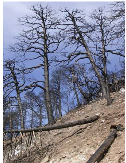
Waldbrandfläche oberhalb Leuk

tretern von Bund, Kanton Wallis, Burgerschaft Leuk (Waldeigentümer) und Vertretern von lokalen Büros setzten sich am 16. September WSL-Forscher über das Ausmass des Brandes ins Bild. Kreisförster Viktor Bregy orientierte ausführlich über die notwendigsten Massnahmen zur Sicherung im Schutzwaldbereich. Der Ausflug hinterliess unterschiedliche Eindrücke. Kenntnisse über Waldbrände und deren Folgen sind an der WSL Sottostazione vorhanden. Das Ausmass des Leuker Waldbrandes ist aber derart eindrücklich, dass unweigerlich Fragen zur Ökologie einer ganzen Talschaft gestellt wurden. Das gesellschaftliche Interesse an diesem Ereignis verebte rascher als nach den Winterstürmen Vivian (Februar 1990) und Lothar (Dezember 1999). Da die unmittelbare Gefahr für Leuk dank grossem Einsatz u.a. auch der Armee eingedämmt wer-