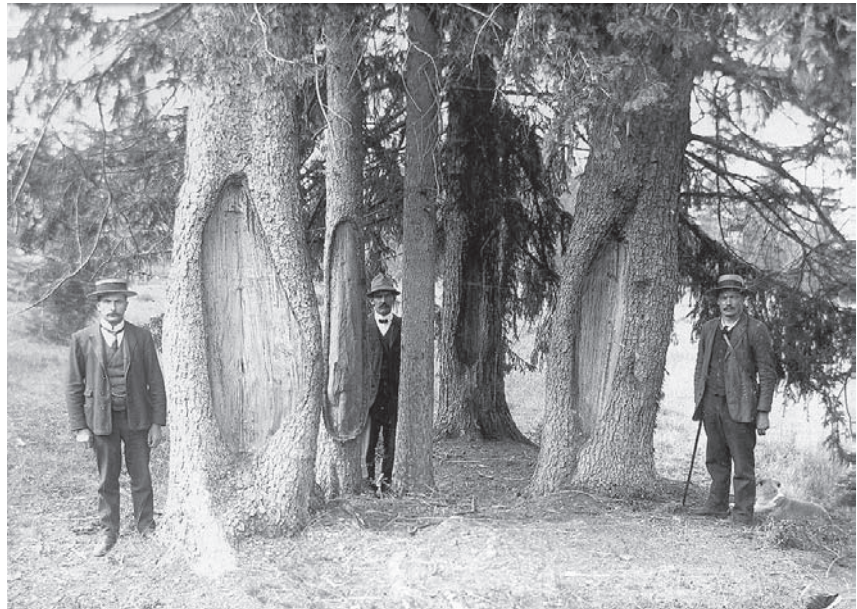
Harzer im Berner Jura. Noch bis weit ins 20. Jahrhundert wurden im Jura Harzfrichten genutzt. Erst die Konkurrenz durch amerikanisches Harz setzte dieser Nutzungsweise ein Ende.