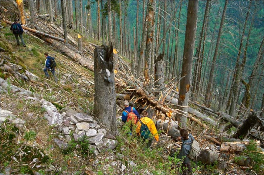
Exkursion durch den Totholzbestand von Gandberg bei Schwanden GL mit Vertretern des Nationalpark Bayerischer Wald, der WSL und der ETH (14.5.2002;).