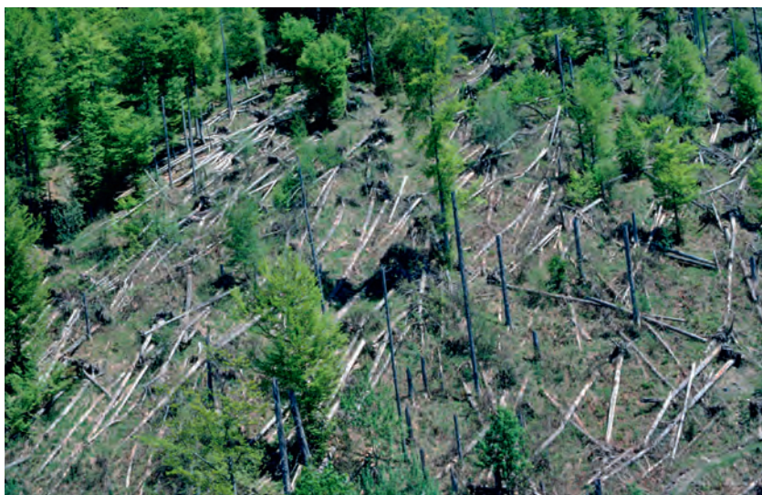
Abb 5 Nicht geräumter Teil der Windwurffläche Schwanden (Glarus). Der Grossteil der Fichtenoberschicht wurde geworfen, die beigemischten Buchen hingegen überstanden den Sturm.

Waldbrandprävention beinhaltet unter anderem vorbeugendes, kontrolliertes Verbrennen des brennbaren organischen Materials («prescribed burning», z.B. Glasgow & Matlack 2007), was das Risiko von katastrophalen Grossbränden reduziert. Diese präventive Massnahme dürfte in der Schweiz aufgrund der hohen Besiedlungsdichte und des enormen Schadenpotenzials kaum je grossflächig zur Anwendung kommen. In Regionen mit erhöhtem Brandrisiko könnte stattdessen kontrollierte Beweidung durch Schmal- oder Grossvieh das Brennmaterial (Kraut- und Strauchschicht) reduzieren. Wichtiger scheint es aber, grossflächige Waldbestände mit waldbrandanfälligen Nadelhölzern zu vermeiden und stattdessen auf resistenteren Laubbaumarten oder Mischbestände auszuweichen.