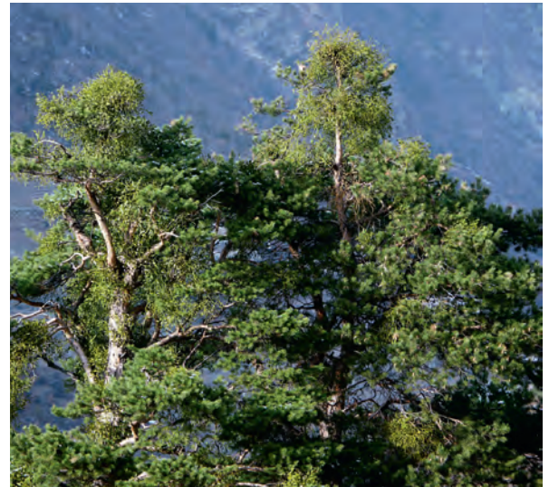
Abb 2 Starker Befall durch die Föhrenmistel bei Stalden (Wallis). Die Föhrenmistel hat sich im Wallis in den vergangenen Jahrzehnten massiv ausgebreitet.

et al 2006). Schliesslich führte die Buchdruckerepidemie ( Ips typographus ), welche als Folge der Stürme Vivian und Lothar sowie des Jahrhundertsommers 2003 seit nunmehr 18 Jahren die Schweiz heimsucht, zu Zwangsnutzungen in der Grössenordnung von 10 Mio. m 3 Fichtenholz ( Picea abies ), wobei schätzungsweise 2.5 Mio. m 3 dem Hitzesommer 2003 zuzuschreiben sind (Meier et al 2006, Forster & Meier 2008).