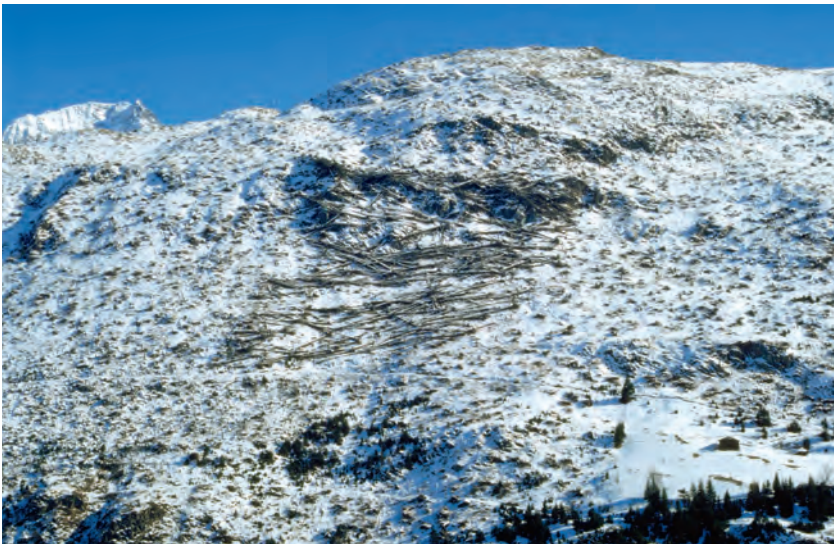
Abb 3 Grossflächiges Experiment zur Wiederbewaldung auf der Vivian-Sturmfläche in Dörsentis (Graubünden): links die geräumte, in der Mitte die belassene und rechts die geräumte und bepflanzte Teilfläche.