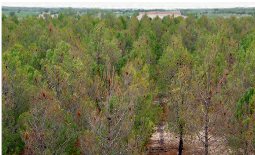
Abb 6 Starker Befall der Aleppo-Kiefer ( Pinus halepensis ) durch den Föhrenprozessions Spinner in Andalusien (Spanien).