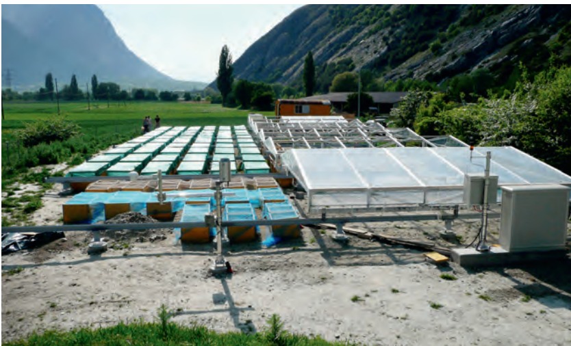
Abb 4 Verjüngungsexperiment bei Leuk (Wallis). Mittels Regendächern und Bodenheizung wird ein zukünftiges, trocken-heisses Klima simuliert und der Effekt auf die Baumverjüngung getestet.

Bäume und Bestände auf unterschiedliche Eingriffe zu prüfen. Einige dieser Versuche waren Experimente der Forschung, andere wurden durch die Praxis durchgeführt, sei dies auf Ebene Forstkreis oder Forstrevier. Viele dieser Experimente und Versuche sind nicht so dokumentiert, dass eine Weiterführung oder nachträgliche Auswertung einfach möglich wären. Wir schlagen deshalb vor, eine internetbasierte Datenbank für waldbauliche Versuche aufzubauen, welche es erlauben würde, früher angesetzte Versuche aus der heutigen Forschungsperspektive im Kontext Klimawandel auszuwerten und so für die Praxis nutzbar zu machen. Ebenso müssten neue Versuche in die Datenbank aufgenommen werden. Die Kriterien, welche an eine Versuchsanordnung zu stellen sind, damit sie in diese Datenbank aufgenommen werden kann, müssten noch definiert werden.