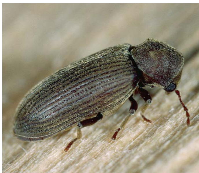
Fig. 2. Vrillette adulte de l'écorce de l'épicéa ( Microbregma emarginatum ).

Dans l'ensemble, les précipitations ont été conformes aux valeurs moyennes dans de nombreuses régions de Suisse. Ce n'est toutefois pas le cas de la Suisse romande, où les précipitations ont été nettement inférieures à la moyenne. Cela pourrait avoir contribué à l'aggravation de la situation observée dans les cantons VD et NE. Dans le canton NE, la vulnérabilité accrue des populations d'épicéas aux attaques du typographe était probablement aussi due, dans certaines régions, au pré-affaiblissement provoqué par les violentes chutes de grêle de l'été 2021 et par la tempête estivale exceptionnellement forte de juillet 2023. A l'instar de la situation en Suisse romande, on constate actuellement une recrudescence du problème du typographe dans les régions françaises voisines, également attribuée à la sécheresse croissante de ces dernières années (Département de la Santé des Forêts, 2024). En raison de la pression croissante des infestations et des conditions climatiques de plus en plus favorables au typographe, une vigilance accrue s'impose, en particulier en Suisse romande.