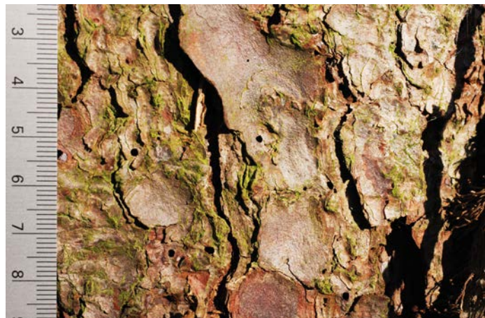
Fig. 3. Orifices d'entrée de M. emarginatum .

cas d'infestation. Si l'on racle la couche supérieure de l'écorce à l'aide d'un couteau, on découvre rapidement laquelle des deux espèces de coléoptères a provoqué les orifices d'entrée. Pour s'assurer qu'il ne s'agit pas d'une attaque mixte, il convient également d'examiner prudemment les sections de tronc concernées à la recherche de galeries (s'arrêter juste avant le cambium).