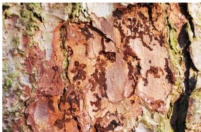
Fig. 4. En haut (A): Galeries de ponte de M. emarginatum . En bas (B): Galeries de ponte du typographe ( Ips typographus ).