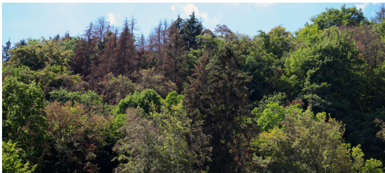
In questo bosco misto, abete rosso e faggio hanno sofferto molto la siccità. Le querce sono sane.

L'entità e la qualità della rinnovazione sono importanti anche per garantire l'effetto protettivo contro i pericoli naturali a lungo termine. L'IFN4 evidenzia che oggi il bosco di protezione è in buone condizioni per quanto riguarda il suo effetto protettivo. Ma oltre alla situazione attuale, è importante anche garantire nel tempo l'efficacia protettiva, per la quale la rinnovazione svolge un ruolo centrale. Qui l'IFN4 evidenzia una riduzione della superficie con un grado di rinnovazione sufficiente nel bosco di protezione. Per contrastare tale situazione, sono necessari interventi regolari volti a promuovere la rinnovazione e a creare quindi il presupposto per popolamenti stratifi-