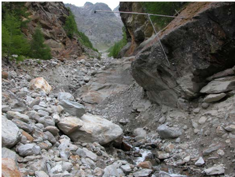
Abb. 3: Blick gerinneaufwärts oberhalb des Kegelhalses. Das obere Echolot und Geophon 2 befinden sich auf der orographisch linken Seite. Sie sind an einem grossen Felsblock angebracht.

Geologisch gesehen befindet sich das Einzugsgebiet im Kristallin. Im oberen Teil des Einzugsgebietes liegen vor allem Gneisse vor. Im Bereich der Anrisszonen ist ein