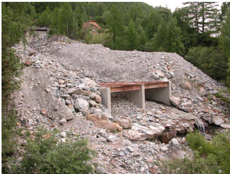
Abb. 1: Der Murgangbrecher im Juni 2003 nach der Räumung der Geschiebeablagerung der Ereignisse im Sommer 2002. Die horizontal in Fliessrichtung verlegten Eisenbahnschienen von 19 m Länge und Zwischenräumen von etwa einem halben Meter bewirken ein Entwässern des Murganggemisches und damit eine Erhöhung der Reibung im Gemisch, was zu einer Ablagerung des Materials auf dem Rost führt. Zusammen mit einem Ablagerungsraum unterhalb der Murgangbremse ergibt sich eine totale Ablagerungskapazität von 12'000 – 15'000 m 3 .

Auf einem horizontalen Stahlrost mit einer Länge von 19 m und einer Breite von 12 m wird dem Murgang ähnlich einem groben Sieb das Wasser entzogen (vgl. Abb. 1). Dadurch vergrössert sich die Reibung und die Geröllmassen werden zur Ablagerung gebracht. Die Murgangbremse, am Ende einer leichten Rechtskurve, soll einen ersten Murgangschub durch Entwässerung des Murkopfes abbremsen und nachfolgendes Material zur Ablagerung bringen. Zusammen mit einem Ablagerungsraum rechts unterhalb der Murgangbremse, welcher mit einem Damm abgeschlossen ist, ergibt sich somit eine maximale Kapazität von etwa 15'000 m 3 . Dadurch können die unterliegenden Strassen- und Eisenbahnbrücken vor dem ersten, meist grössten Schub geschützt werden.