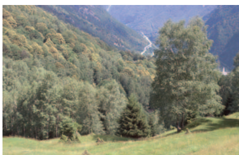
Mont Grand: un prato con castagni inselvatichito in seguito alla colonizzazione di betulle e abeti rossi.

Contatto: Claudia Schreiber, 032/323 38 46, schreiber_c@bluewin.ch Direzione progetto: Priska Baur, 01/363 81 28, priska.baur@wsl.ch