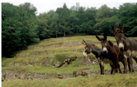
Terrazzamenti a Soazza tenuti aperti con il pascolo degli asini.