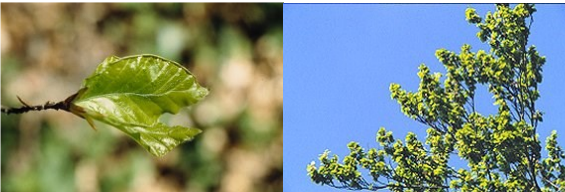
Après le stade de référence: les nouvelles feuilles sont déployées et le limbe foliaire est entièrement visible.