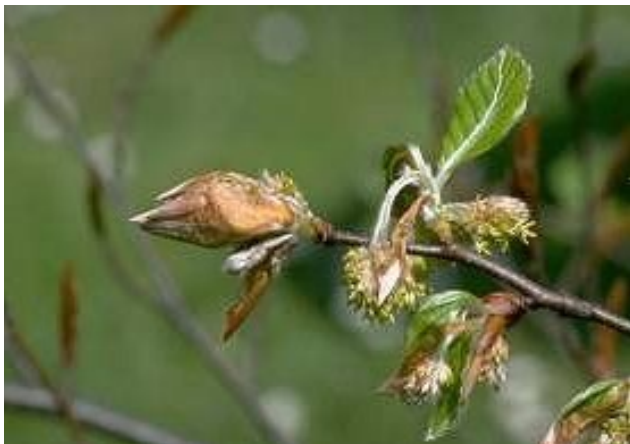
Inflorescence mâle chez le hêtre

Les fleurs de l'inflorescence mâle (chatons globuleux, pendants, à longs pédoncules et à nombreuses fleurs) sont ouvertes et commencent à libérer du pollen jaune. Par jour de vent, la dispersion du pollen est visible.