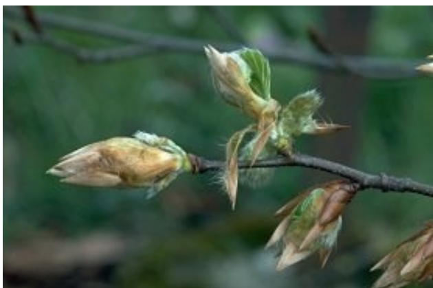
Inflorescence femelle chez le hêtre