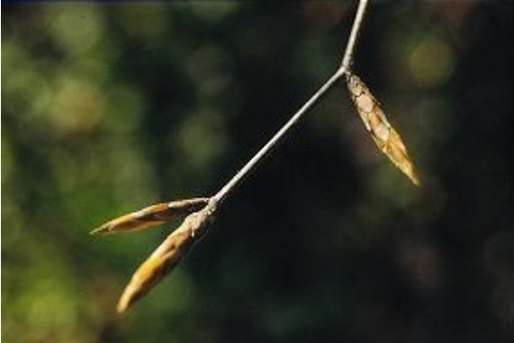
Avant le stade de référence : Bourgeons fermés.