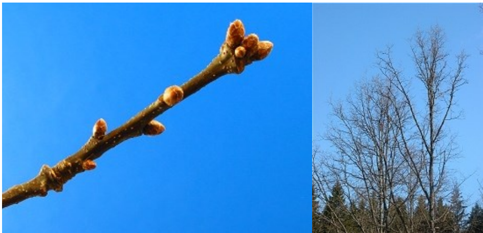
Avant le stade de référence : Bourgeons fermés.