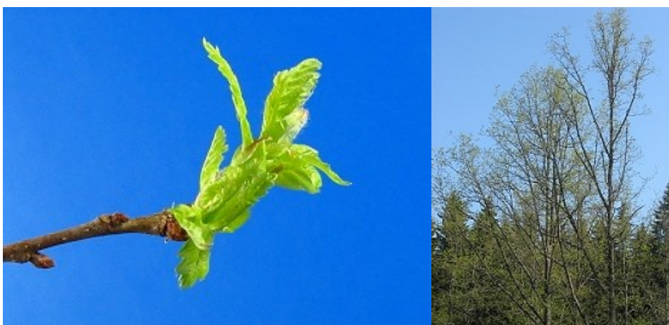
Après le stade de référence: les nouvelles feuilles sont déployées et le limbe foliaire est entièrement visible.