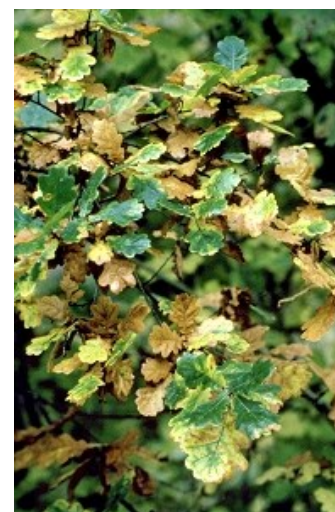
Coloration automnale chez le chêne