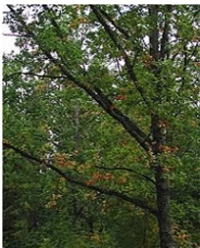
Début du jaunissement chez le chêne

La couleur des feuilles est passée du vert au jaune, brun-jaune ou brun-rouge. Souvent, la coloration des feuilles individuelles n'est que partielle. L'estimation de la coloration automnale fait référence à la surface foliaire totale, y compris la surface des feuilles qui sont déjà tombées.